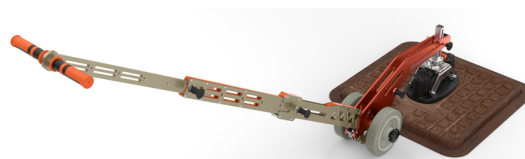
Carrello LIFTOP + Vacuum Lifting Kit con Grabo