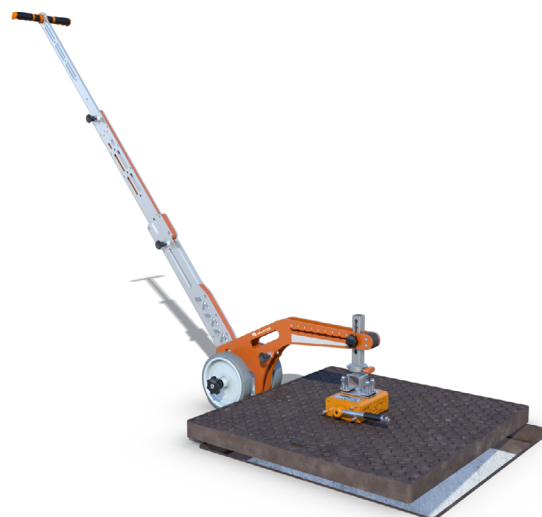
Carrello LIFTOP Magnetic con chiusino 80x80 cm