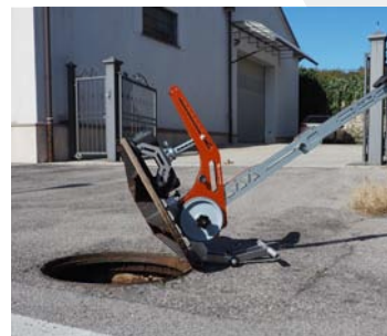
Per chiusini incernierati