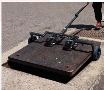
Per chiusini ferromagnetici