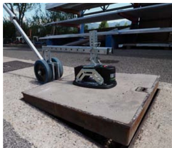
Per chiusini a riempimento