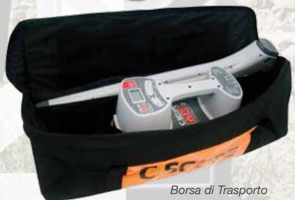
Borsa di Trasporto