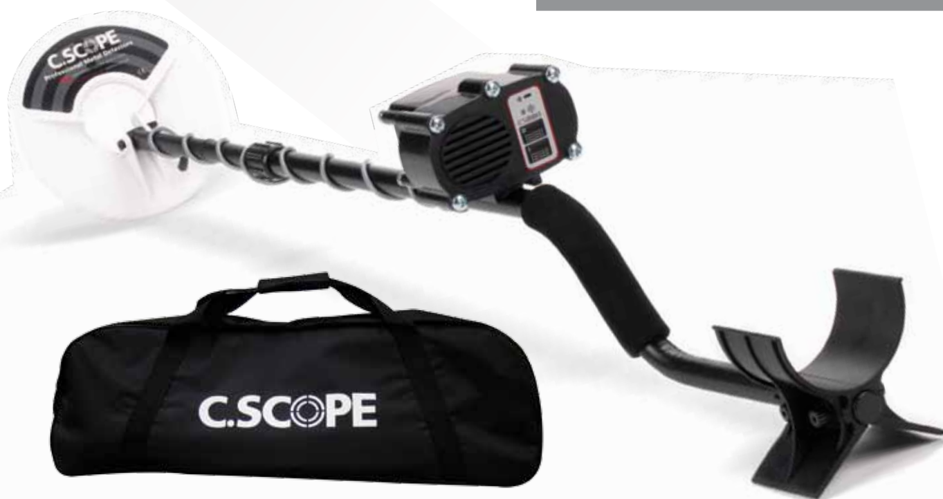
Borsa di Trasporto